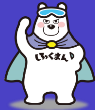
ブランシュのゆるキャラじくまん

ブランシュたかやまスキーリゾートは、今や全国でも数少ない スキーヤー専用のゲレンデ の為、特に教育旅行の現場においては 安心・安全なスキー場 として認知されています。